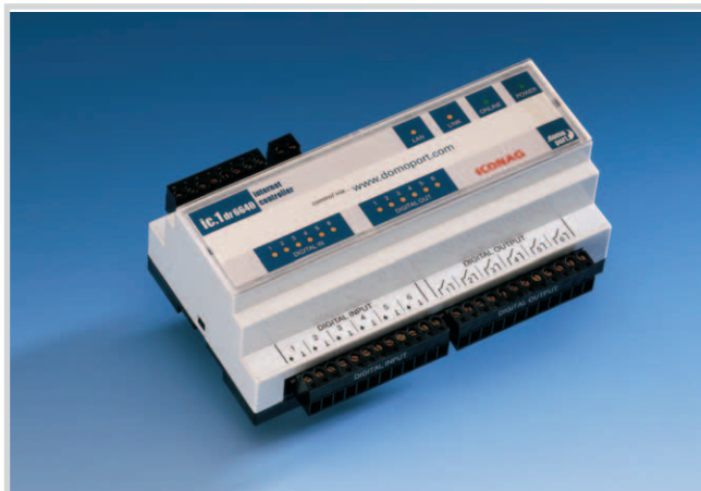
ic.1 dr6640 M-BUS

Der ic.1 dr6640 M-Bus ist ein vollwertiger dr6640 internet controller mit 6 digitalen Eingängen, 6 digitalen Ausgängen, 4 analogen Eingängen, 2 USB Schnittstellen für Videomodule, optionalem Modem (analog, ISDN, GSM/GPRS) und Ethernet Anschluss (10/100BaseT). Zusätzlich besitzt das M-Bus Gerät eine serielle Schnittstelle (RS232-DTE) zum Anschluss eines M-Bus Pegelwandlers (z.B. Relay PW60).